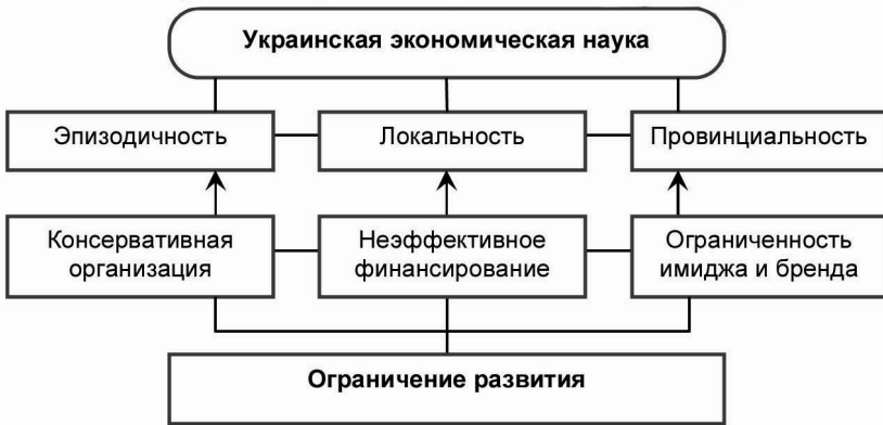
Рис. 2. Регрессивные изъяны украинской экономической науки

Следует отметить, что хотя в мире и наблюдается тенденция к относительному сокращению непосредственно государственного финансирования университетского образования и науки, диверсификация их источников развития происходит в поле общенационального приоритета, что, к сожалению, не присуще современному украинскому обществу.