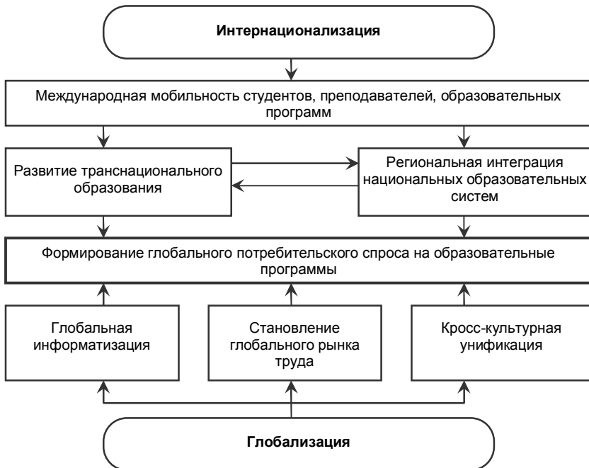
Рис. 3. Интернационализация и глобализация университетского образования

Следует отметить, что хотя в мире и наблюдается тенденция к относительному сокращению непосредственно государственного финансирования университетского образования и науки, диверсификация их источников развития происходит в поле общенационального приоритета, что, к сожалению, не присуще современному украинскому обществу.