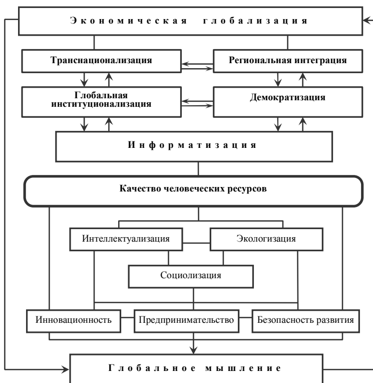
Рис. 1. Императивы и детерминанты глобализационного прогресса

Несмотря на общепризнанное позиционирование Украины как страны с достаточно высоким интеллектуальным потенциалом, вследствие высокой образовательной составляющей человеческого развития [ Капіталізація економіки України , 2007, с. 220], в её экономике доминируют третий и, частично, четвертый технологические уклады (табл. 1).