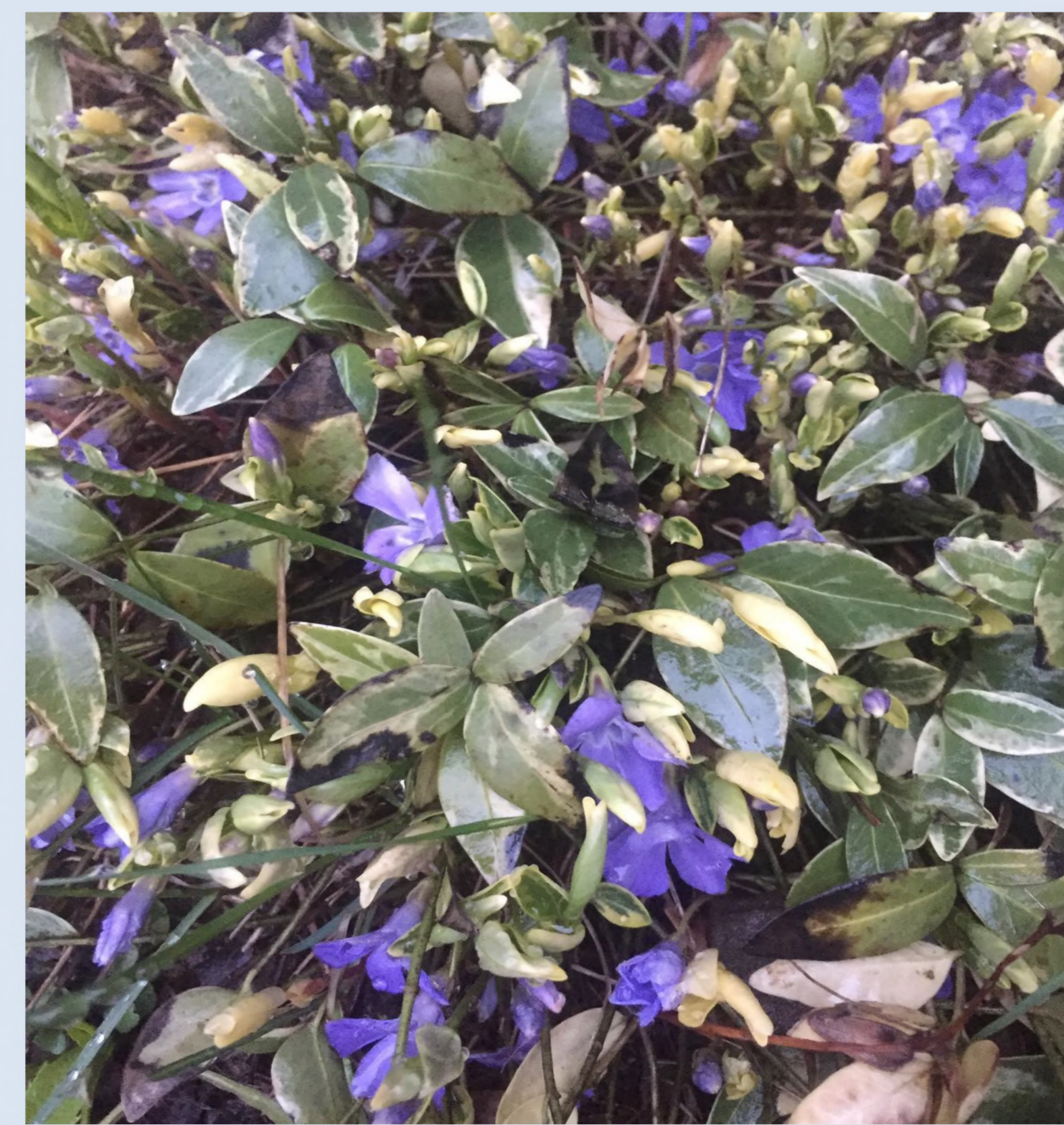
Barwinek Pospolity ( Vinca Minor)