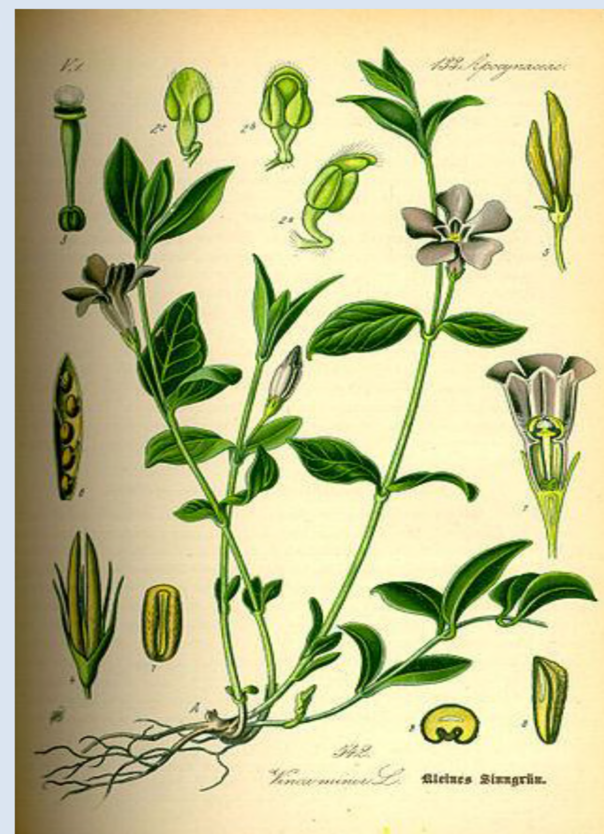
Charakterystyka Barwinka Pospolitego https://upload.wikimedia.org/wikipedia/commons/thumb/c/cc/Illustration_Vinca_minor0.jpg/320px-Illustration_Vinca_minor0.jpg