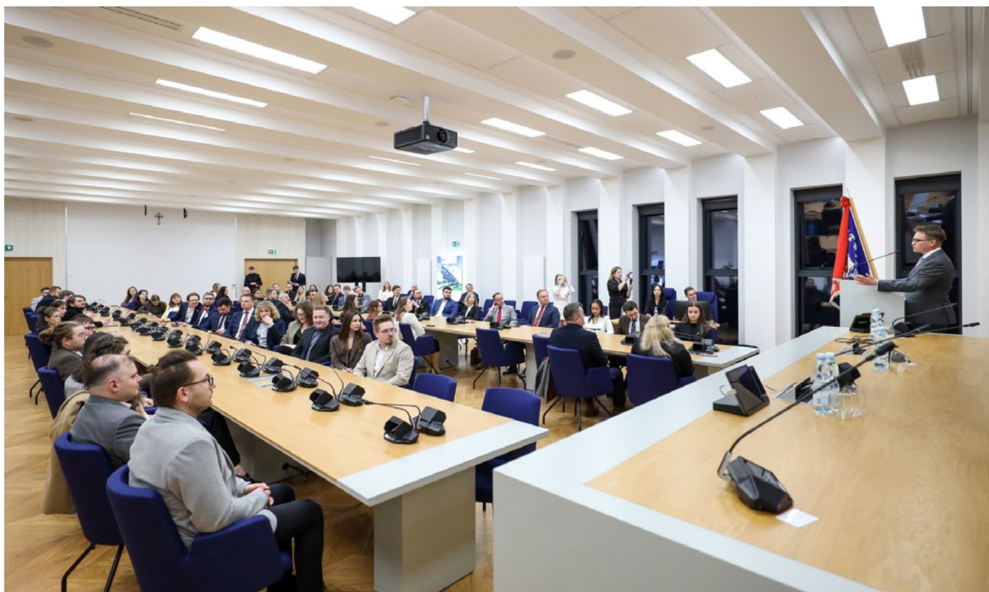
W dniach 13–15 marca 2026 r. po raz pierwszy w murach Uniwersytetu Rzeszowskiego odbyło się Pierwsze Otwarte Posiedzenie Zarządu Krajowej Reprezentacji Doktorantów (KRD)

Szkoła Doktorska Uniwersytetu Rzeszowskiego została utworzona w 2019 r., kontynuowała wieloletnie doświadczenia Uczelni w kształceniu młodej kadry naukowej w ramach studiów doktoranckich. Jej międzyobszarowy i interdyscyplinarny charakter tworzy przestrzeń do prowadzenia ambitnych badań naukowych i artystycznych, odpowiadających na współczesne wyzwania nauki, kultury, gospodarki i społeczeństwa.