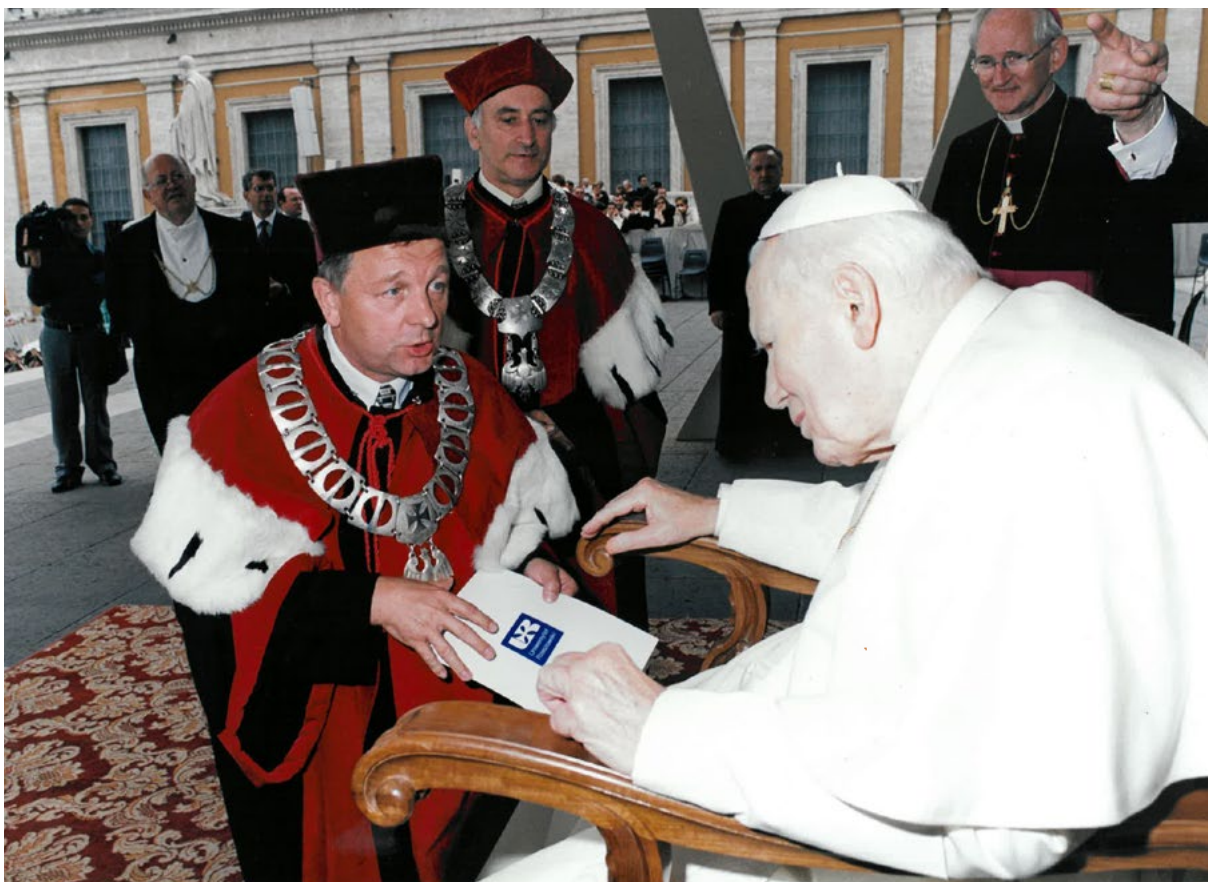
Watykan, 5 czerwca 2002 r.