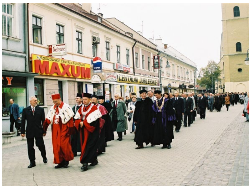
11 października 2001 r. odbyła się pierwsza w Uniwersytecie Rzeszowskim inauguracja roku akademickiego. Na zdjęciu pochód władz UR z kościoła farnego do filharmonii