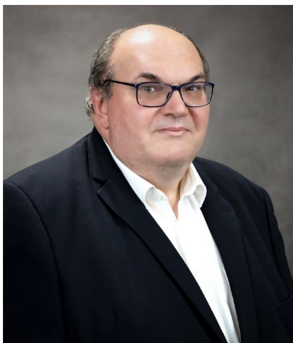
Prorektor ds. Collegium Medicum Uniwersytetu Rzeszowskiego