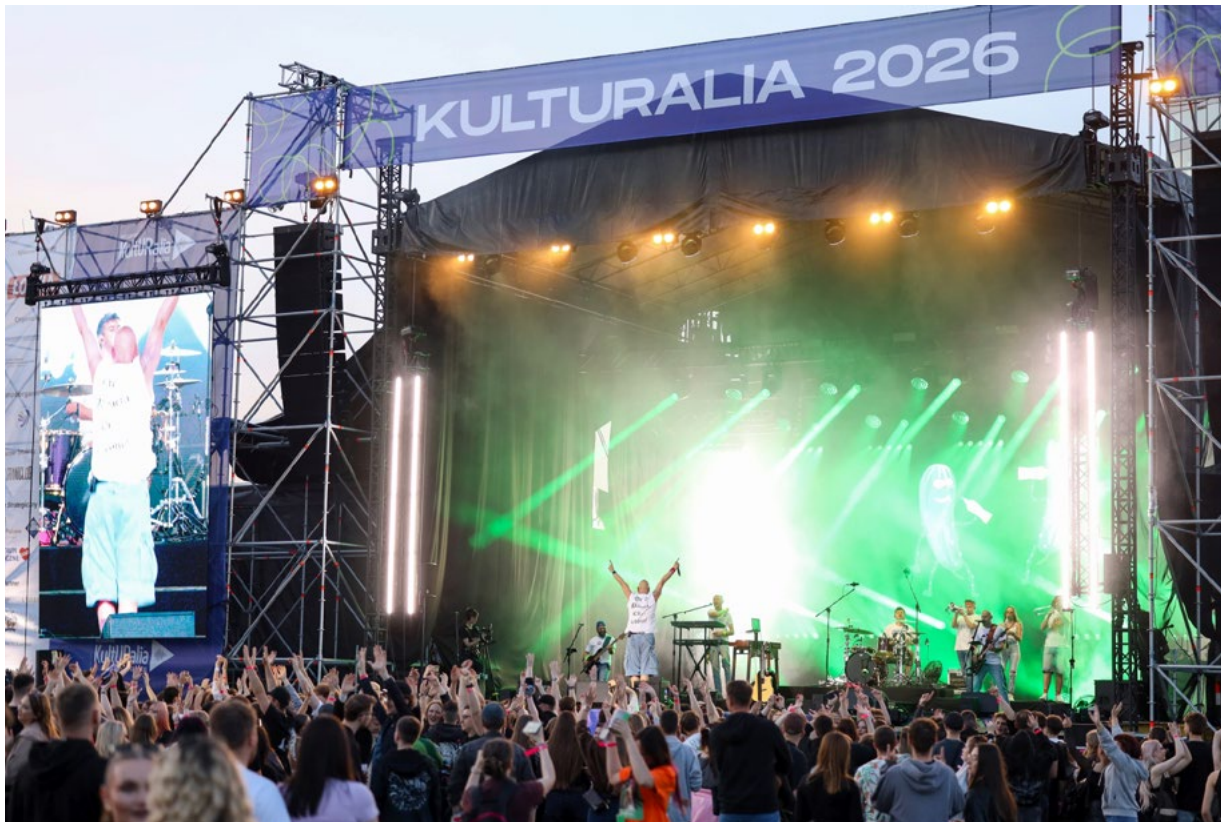
KultURalia 2026 odbyły się na Podpromiu w Rzeszowie

Nieodłącznym elementem była współpraca z władzami uczelni, która stopniowo przybierała bardziej partnerski charakter. Studenci mieli możliwość realizowania własnych pomysłów, jednocześnie funkcjonując w ramach instytucji i ucząc się odpowiedzialności w swoich działaniach. Relacje te sprzyjały rozwojowi najważniejszych projektów i wzmacniały sprawczość samorządu.