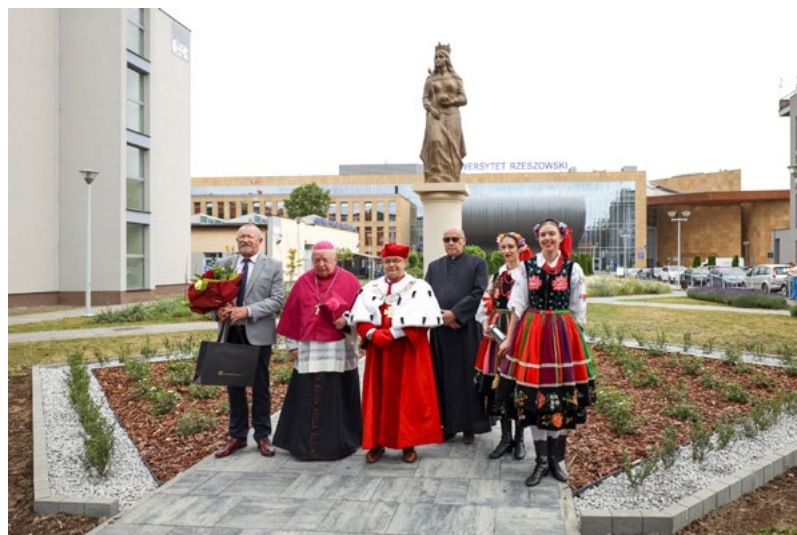
W postumencie pomnika umieszczono kapsułę czasu, a w niej przedmioty i dokumenty o wartości historycznej dla przyszłych pokoleń