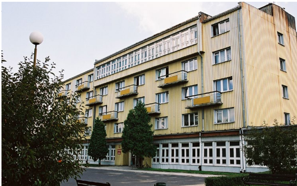
Budynki Zamiejscowego Wydziału Ekonomiki Produkcji i Obrotu Rolnego Akademii Rolniczej im. Hugona Kołłątaja w Krakowie, kampus w Rzeszowie-Zalesiu.