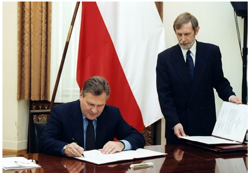
Prezydent Aleksander Kwaśniewski podpisuje ustawę o utworzeniu Uniwersytetu Rzeszowskiego,