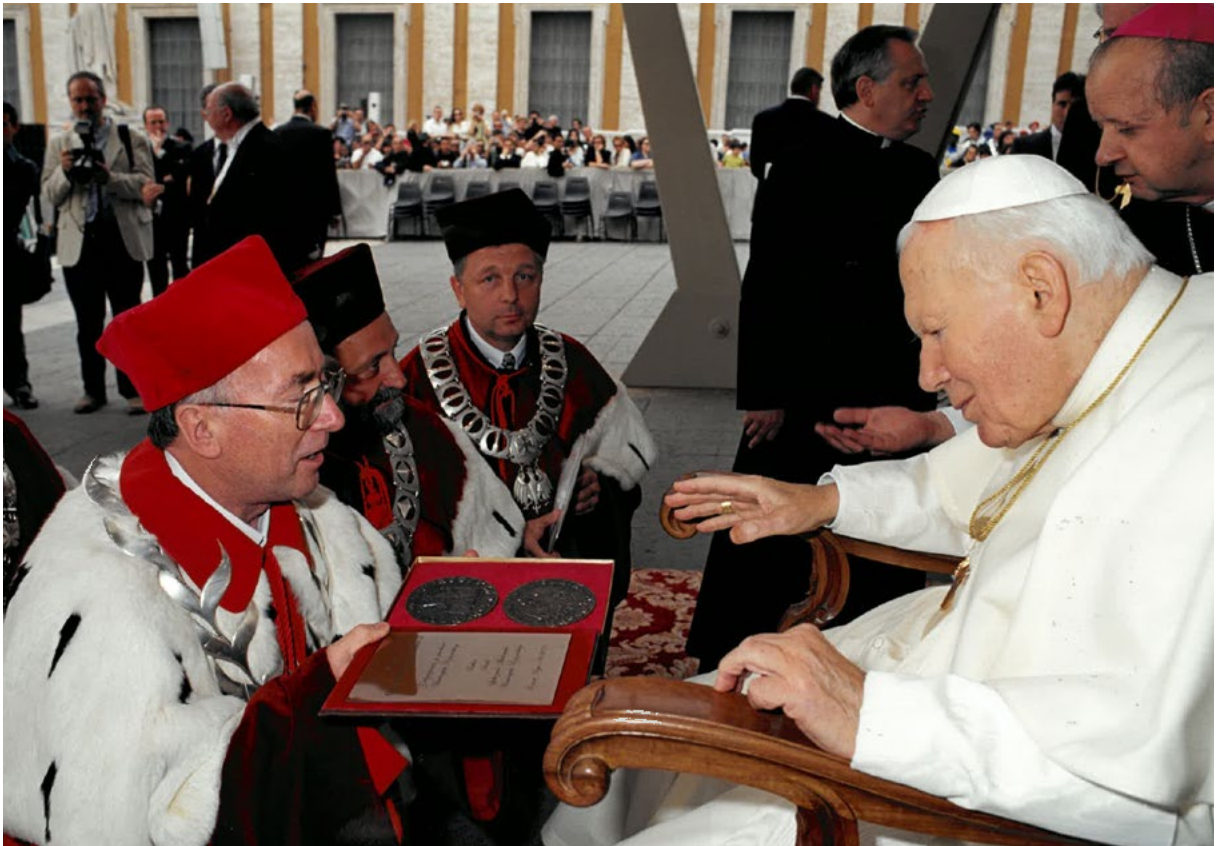
Watykan, 5 czerwca 2002 r.

wersytetu. Wydarzenie to było możliwe dzięki wsparciu Kazimierza Górnego , biskupa rzeszowskiego, który był wielkim orędownikiem utworzenia uniwersytetu. Poza wymiarem religijnym wyjazd do Włoch miał służyć integrowaniu pracowników nowo powstałego uniwersytetu, którzy jeszcze rok wcześniej prowadzili działalność naukową i dydaktyczną