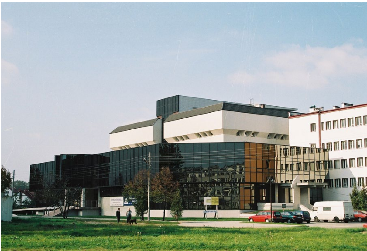
W Bibliotece Uniwersytetu Rzeszowskiego zgromadzono prawie 750 000 woluminów

– powinno mieć przedstawiciela w radzie fundacji. Ustaliliśmy również, że powołana fundacja nie będzie zawierała w swojej nazwie słowa „uniwersytet”, lecz będzie nosiła nazwę Fundacja Rozwoju Ośrodka Akademickiego w Rzeszowie. [...]