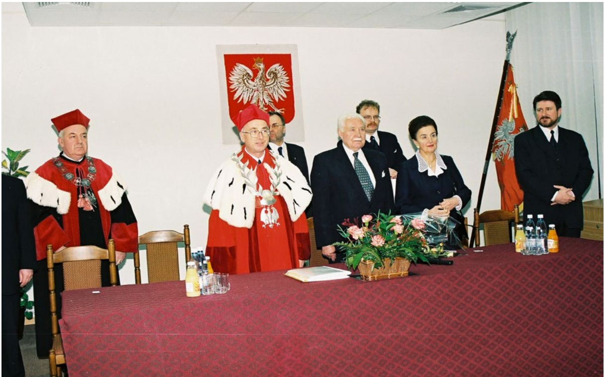
Ryszard Kaczorowski – ostatni Prezydent Rzeczypospolitej na Uchodźstwie z wizytą w UR, 6 marca 2002 r.

tor dwóch kadencji uważa, że „Uniwersytet Rzeszowski odnotował w pierwszym roku działalności szereg ważnych wydarzeń. Niewątpliwie najważniejsze z nich to ustalenie logo uczelni, nadanie jej sztandaru przez samorząd województwa podkarpackiego, pielgrzymka delegacji UR do papieża Jana Pawła II, wybór nowych władz uczelni i wydziałów oraz przyjęcie dokumentów związanych z bieżącym funkcjonowaniem uczelni, takich jak: Statut UR, regulamin studiów, zasady rekrutacji na rok akademicki 2002/2003, założenia decentralizacji finansów oraz utworzenie Uczelnianego Laboratorium Sieci Komputerowej i Oprogramowania. (...) zarówno z przyczyn obiektywnych, jak i subiektywnych dość trudno przebiegał proces scalania trzech odrębnych dotychczas jednostek organizacyjnych w jedną całość. Przyczyny obiektywne to wspomniane już usterki ustawy, zaś subiektywne wynikały z przywiązania pracow-