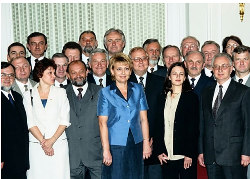
W kancelarii Prezydenta Rzeczypospolitej Polskiej tuż po podpisaniu ustawy o utworzeniu Uniwersytetu Rzeszowskiego