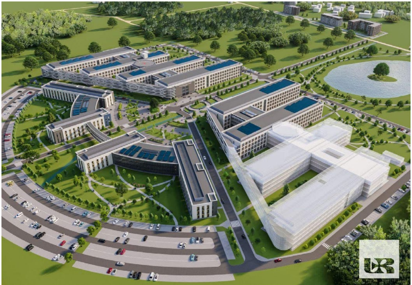
Wizualizacja Uniwersyteckiego Szpitala Klinicznego w Świlczy – Pracownia S.T. Architekci

– W tym roku akademickim na Uniwersytecie studiuje 15 980 studentów. W Szkole Doktorskiej kształcą się 110 osób, a na studiach podyplomowych wykształcenie uzupełniają 670 słuchaczy, dostosowując swoje kwalifikacje do zmieniających się potrzeb rynku pracy. Uczelnia cieszy się również zainteresowaniem kandydatów z zagranicy – obecnie studiuje tu 346 osób z innych krajów. Coraz liczniejsze jest także grono nauczycieli akademickich – aktualnie uczelnia zatrudnia 1481 osób. Co trzecia z nich posiada co naj-