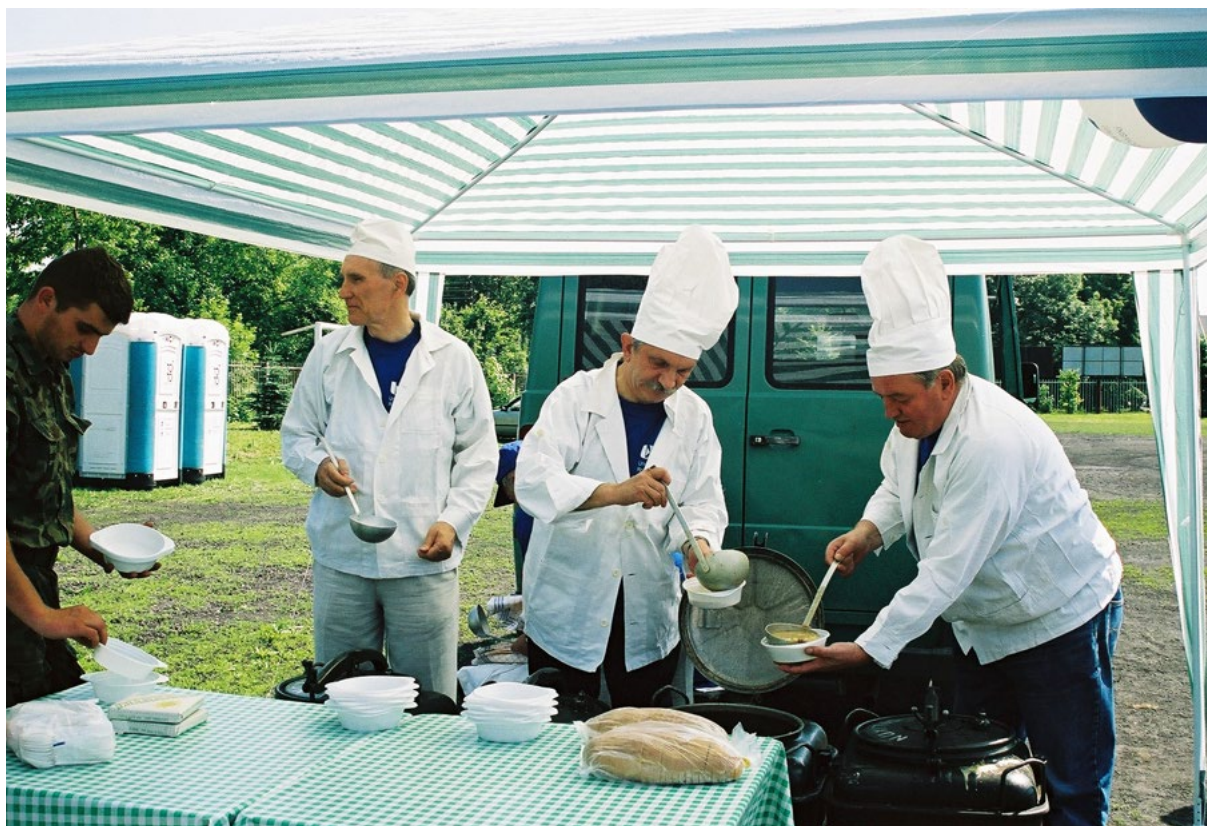
W czerwcu 2003 r. w Rzeszowie obchodzone Dni Uniwersytetu Rzeszowskiego. Trzecią rocznicę utworzenia uczelni uczczono m.in. piknikiem na stadionie Resovii

nych, problemach finansowych, braku kadrowych, konieczności porządkowania spraw związanych z budową nowej jednostki powstałej z kilku różnych organizmów o różnych doświadczeniach, zwyczajach i strukturach. Wiedział, że instytucji nie buduje się samymi deklaracjami. Potrzeba do tego cierpliwej pracy, zgody, odpowiedzialności i dobrej organizacji. Nie ukrywał problemów, ale też nigdy nie tracił wiary w możliwości rozwoju Uniwersytetu.