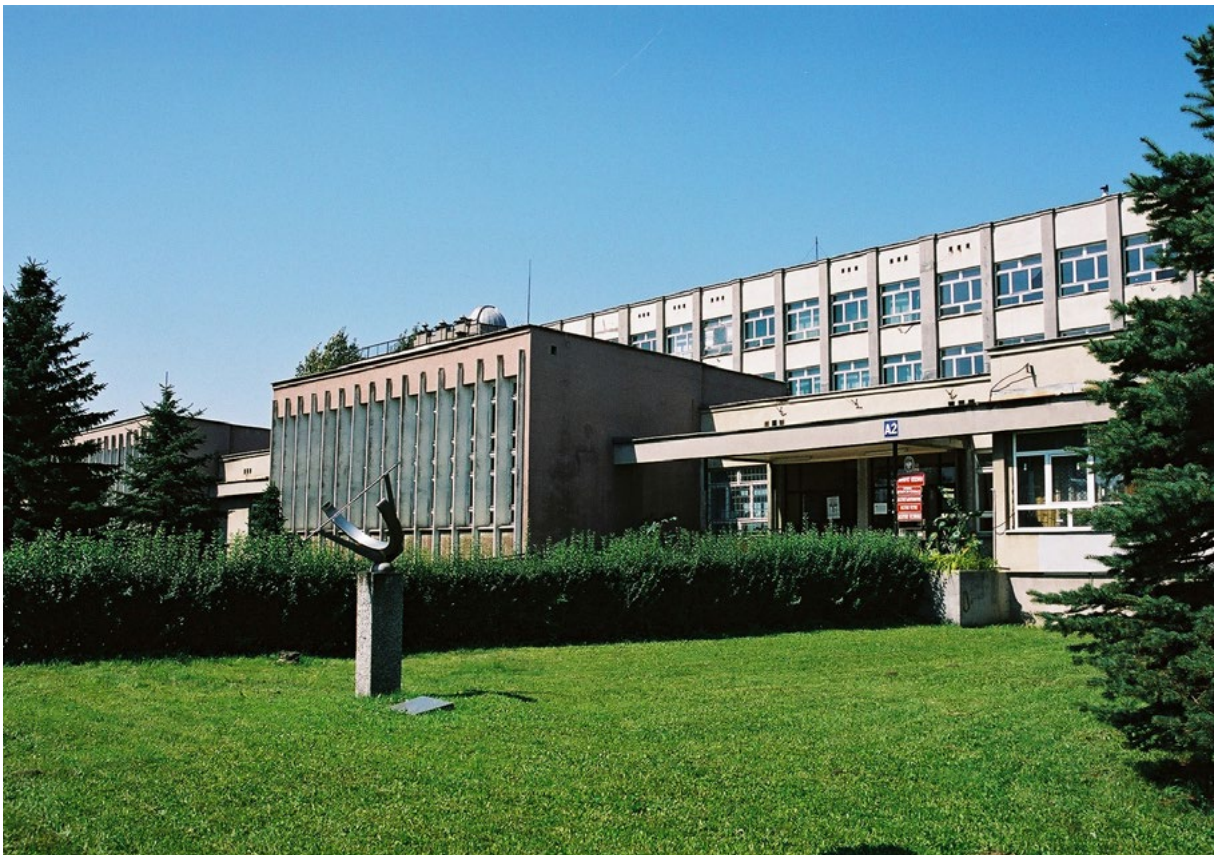
Budynek A2 w kampusie Rejtana, wybudowany dla Wyższej Szkoły Pedagogicznej w Rzeszowie