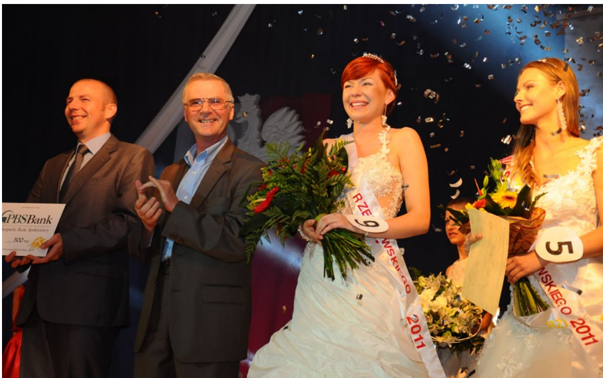
Pierwsze w Uniwersytecie Rzeszowskim wybory miss uczelni

puterowego; Przyrodniczo-Medyczne Centrum Badań Innowacyjnych; Podkarpackie Centrum Innowacyjno-Badawcze Środowiska w Rzeszowie; Centrum Innowacyjnych Technologii.