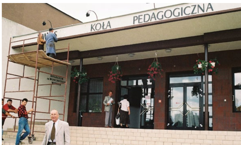
W 2001 roku WSP zakończyła działalność

uniwersytet jest czynnikiem zmianotwórczym.