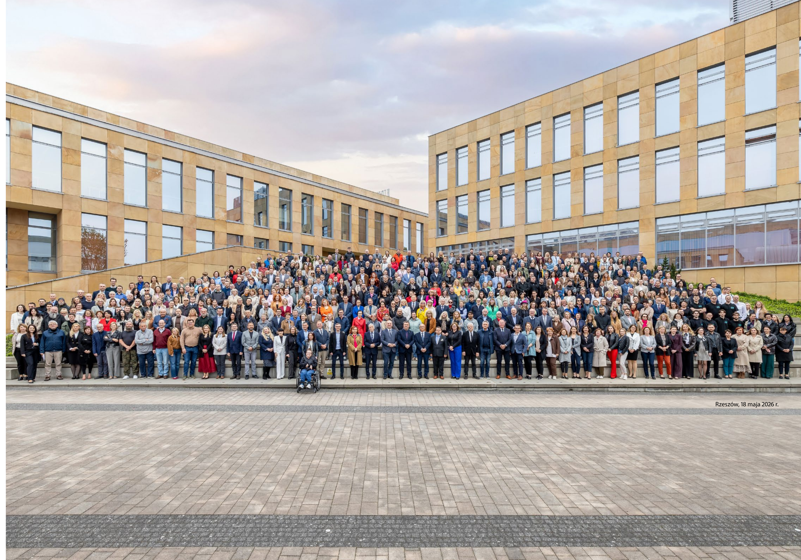
Rzeszów, 18 maja 2026 r.