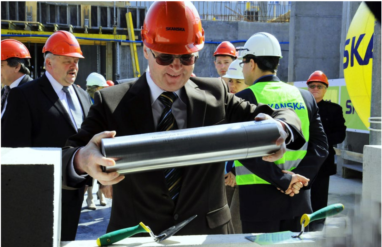
Wmurowanie aktów erekcyjnych pod budowę centrów naukowych finansowanych ze środków Unii Europejskiej. Obecnie budynek A0 w kampusie Rejtana