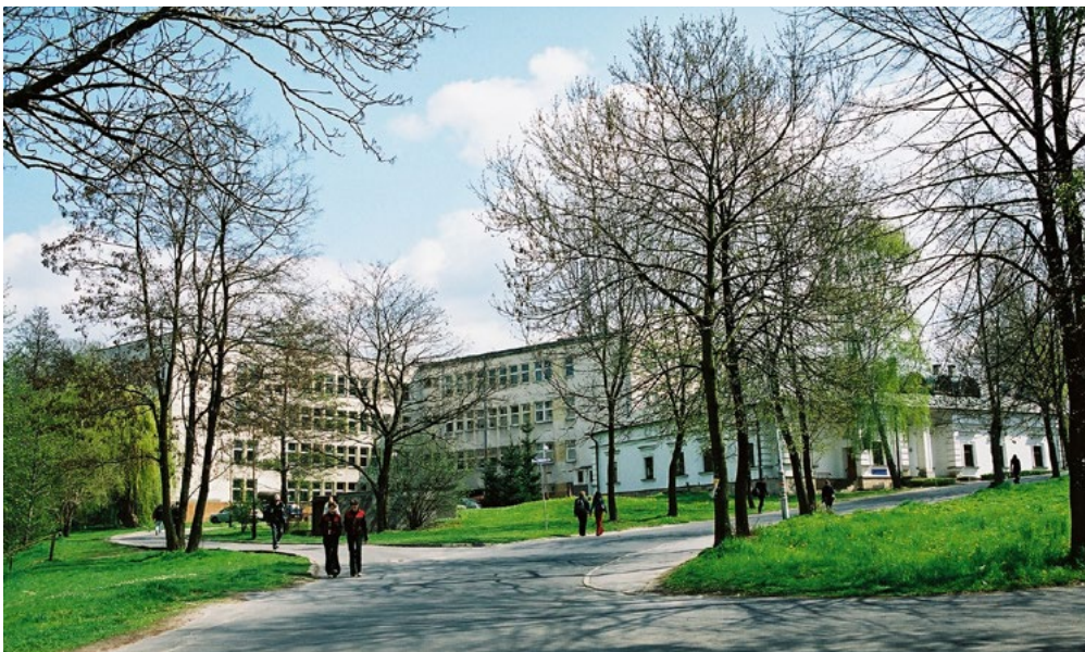
Budynki Zamiejscowego Wydziału Ekonomiki Produkcji i Obrotu Rolnego Akademii Rolniczej im. Hugona Kołłątaja w Krakowie, kampus w Rzeszowie-Zalesiu.

W rzeszowskiej filii były dwa wydziały: Wydział Ekonomiki i Produkcji Rolniczej, którym kierowali: doc. dr hab.