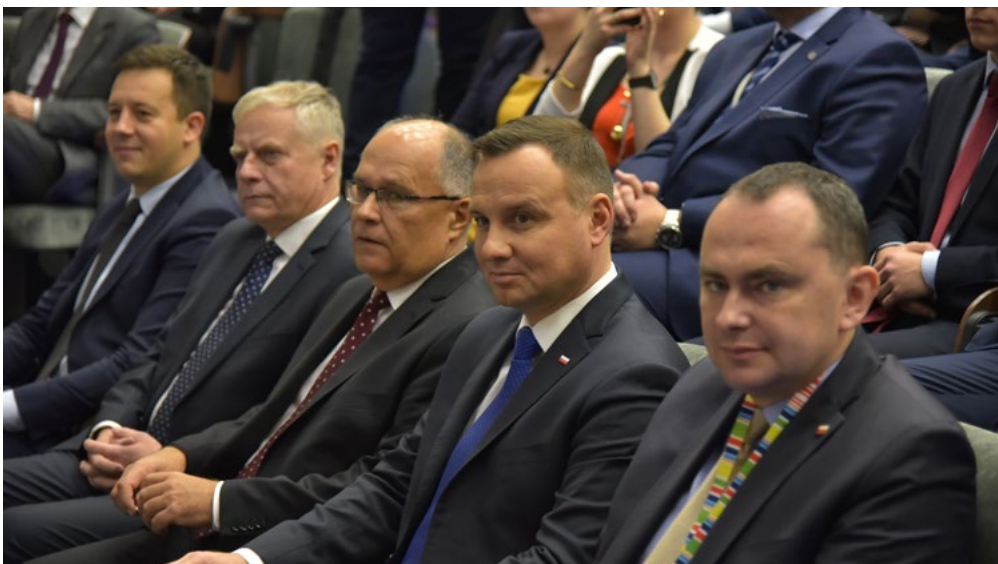
Z wizytą na Uniwersytecie Rzeszowskim (16 listopada 2017 r.) przebywał Prezydent RP Andrzej Duda