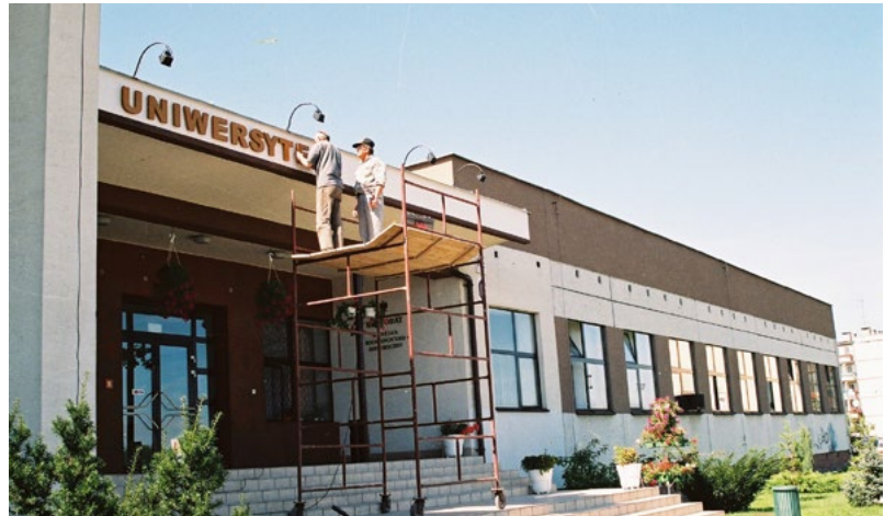
Pierwszy rok akademicki Uniwersytetu Rzeszowskiego rozpoczął się 1 września 2001 r.

Studenci i absolwenci zakładają innowacyjne firmy (startupy), tworzą nowe miejsca pracy w zaawansowanych technologiach. Uczelnia dostarcza miastu ekspertów, którzy pomagają w rozwiązywaniu lokalnych problemów. Ołbrzymie rzesze absolwentów uczelni Rzeszowa, w tym UR, każdego roku zasilają społeczność Podkarpacia ludźmi z dyplomami wyższych uczelni. Uniwersytet promuje każdego roku ok. 6000 absolwentów, w ciągu 25 lat swojej działalności wzbogacił region potrzebnymi kadrami. Nie ma więc przesady w stwierdzeniu, że UR zmienia oblicze Podkarpacia.