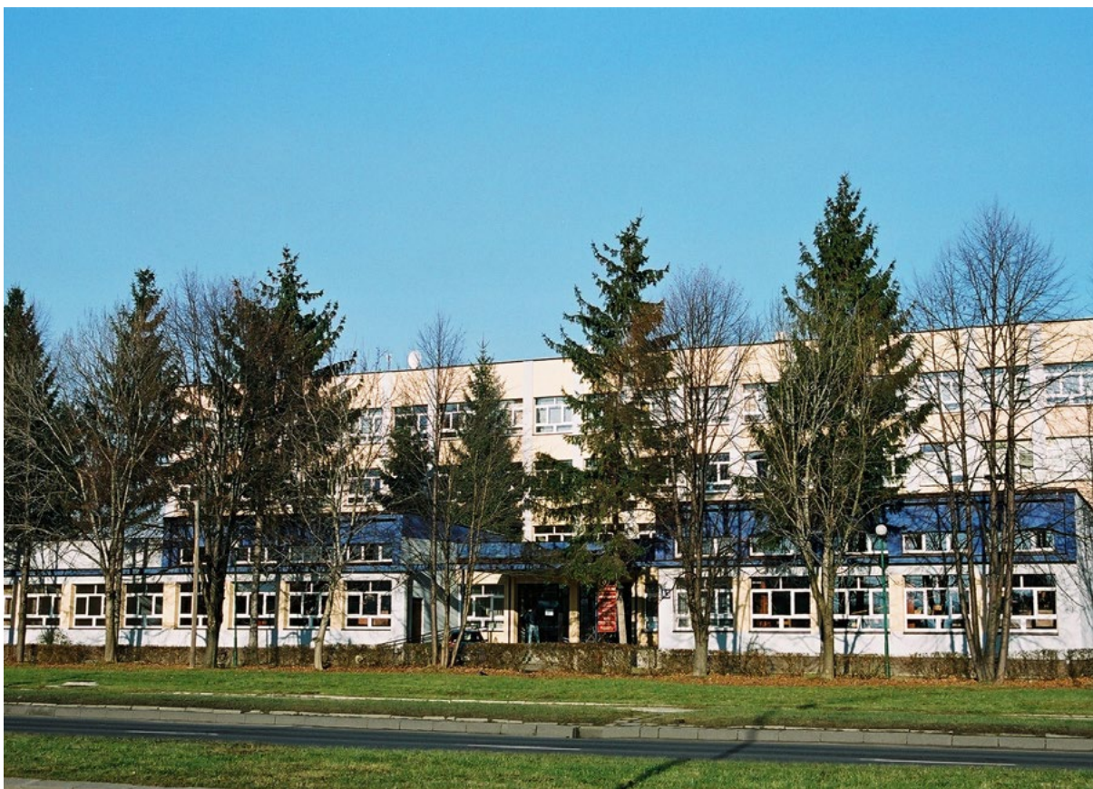
Budynek A3 w kampusie Rejtana, wybudowany dla Wyższej Szkoły Pedagogicznej w Rzeszowie

łudniowo-wschodniej Polski. Szybki rozwój miasta już po kilku latach uwi- docznił jednak deficyt kadr technicznych, urzędniczych i nauczycielskich, trudny do zredukowania w sytuacji braku uczelni wyższych w regionie. Działania koncepcyjne w kierunku utworzenia ośrodka akademickiego