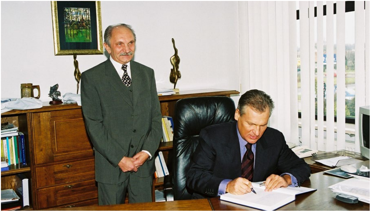
Wizyta Prezydenta Aleksandra Kwaśniewskiego w Uniwersytecie Rzeszowskim 8 listopada 2002 r.

regionie, bez konieczności opuszczania rodzinnych stron.