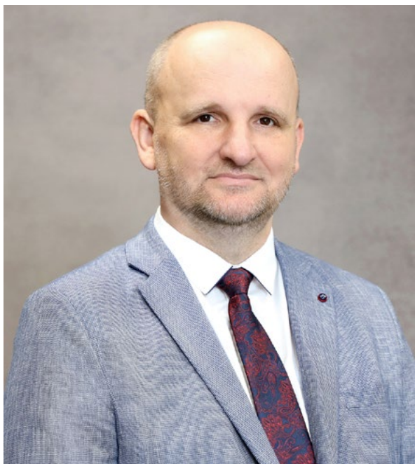
Prorektor ds. Finansów i Rozwoju Uniwersytetu Rzeszowskiego