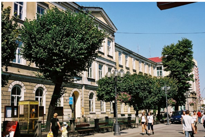
Budynek Filii Uniwersytetu Marii Curie-Skłodowskiej w Rzeszowie przy ul. Grunwaldzkiej.

W latach 70. i 80. Filia UMCS w Rzeszowie dynamicznie się rozwijała. Posze-