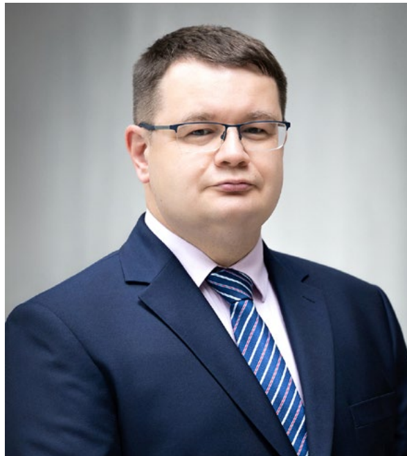
Rektor Uniwersytetu Rzeszowskiego