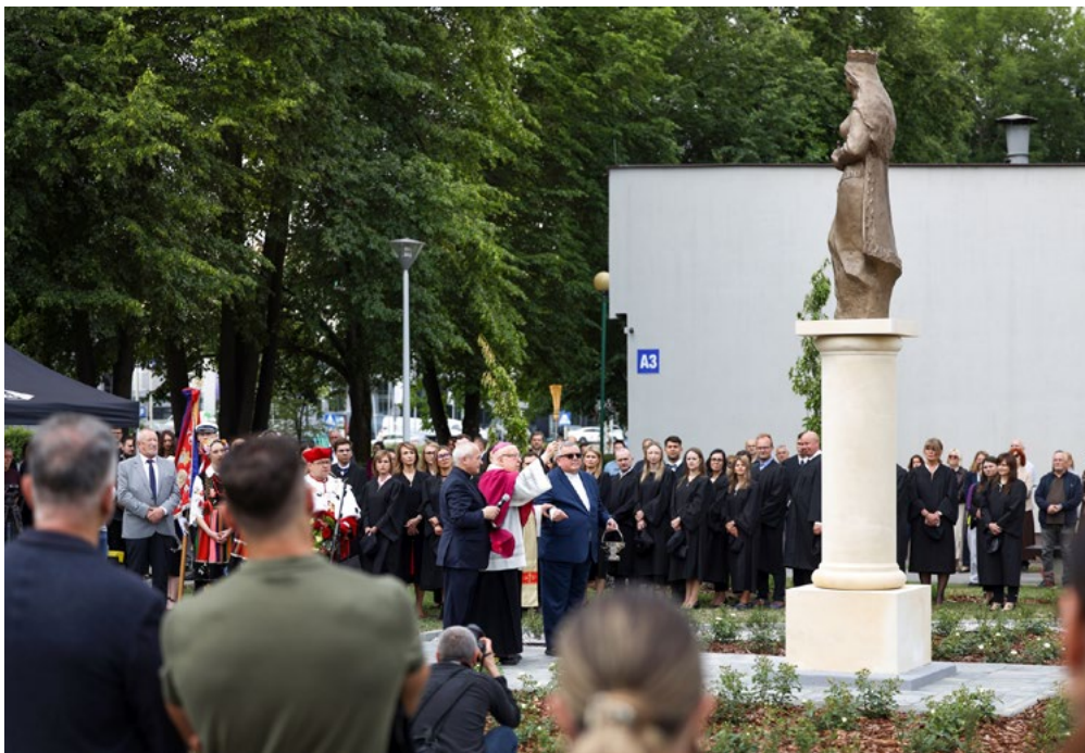
W 25. rocznicę powołania Uniwersytetu Rzeszowskiego pomnik patronki uczelni poświęcił ks. biskup Kazimierz Górny

Pracę nad pomnikiem Profesor rozpoczął jesienią ubiegłego roku od wykonania modelu w skali 1:5, obecnie ta rzeź-