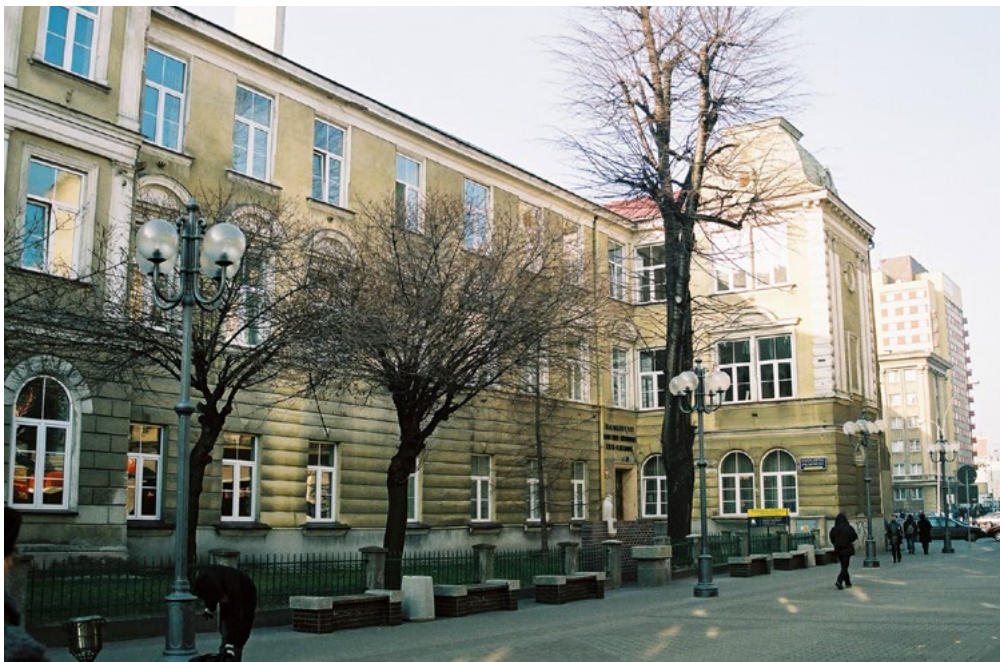
Ulica Grunwaldzka wiosną 2002 r.

rzano ofertę kształcenia oraz zwiększono liczbę studentów. W 1972 r. uruchomiono dwuletnie uzupełniające studia magisterskie na kierunku administracja, a w 1980 r. rozpoczęto stacjonarne studia prawnicze. Istotnym elementem działalności filii było także kształcenie ekonomiczne. Już od 1968 r. funkcjonowała rzeszowska Filia Wydziału Ekonomicznego UMCS, która była silnie powiązana z macierzystą uczelnią w Lublinie.