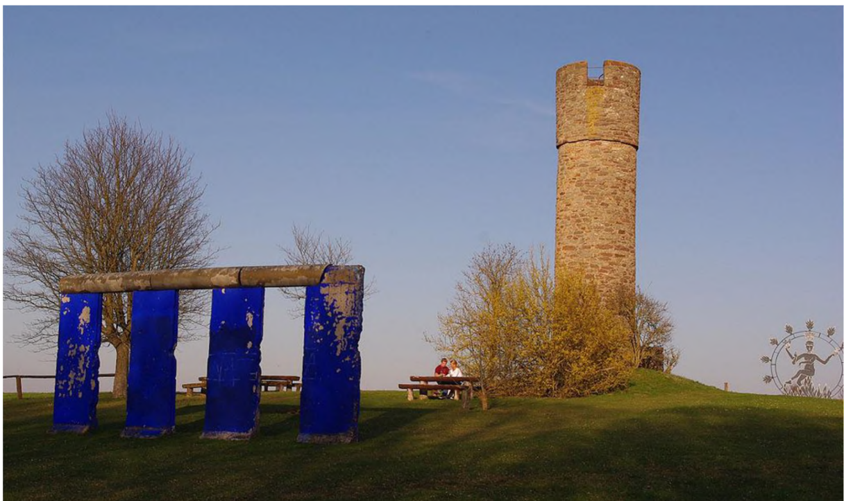
Blaues Tor 1 – West-Tor ( Jimmy Fell )

https://de.wikipedia.org/wiki/Berliner_Mauer#/media/File:Berlin-Steglitz_vor_Matth%C3%A4uskirche_Leid_an_der_Mauer.jpg