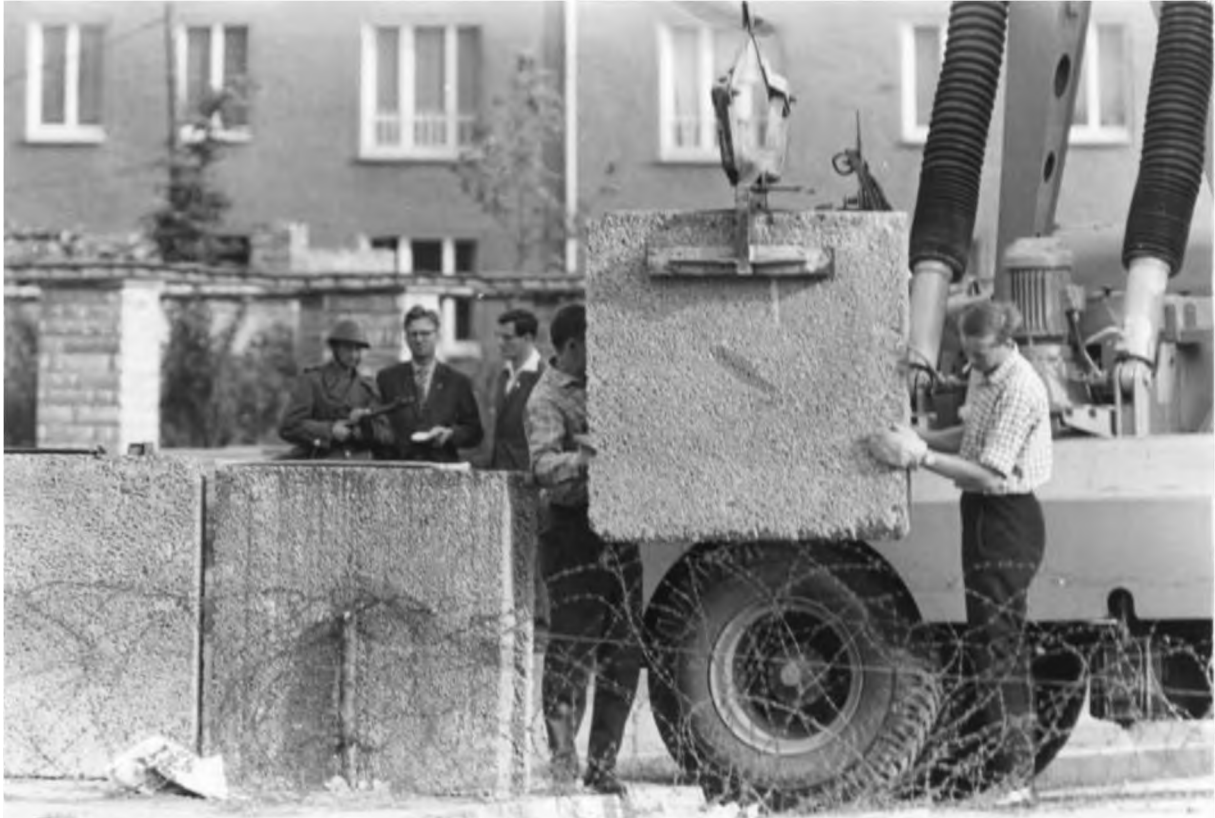
Mauerbau, Aufstellen von Betonblöcken, 1961

https://de.wikipedia.org/wiki/Berliner_Mauer#/media/File:Bundesarchiv_Bild_173-1321,_Berlin,_Mauerbau.jpg