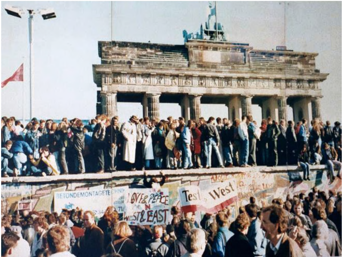
9. Menschenmengen auf der Berliner Mauer Ende 1989 nach dem historischen Mauerfall

https://de.wikipedia.org/wiki/Berliner_Mauer#/media/File:Thefalloftheberlinwall1989.JPG