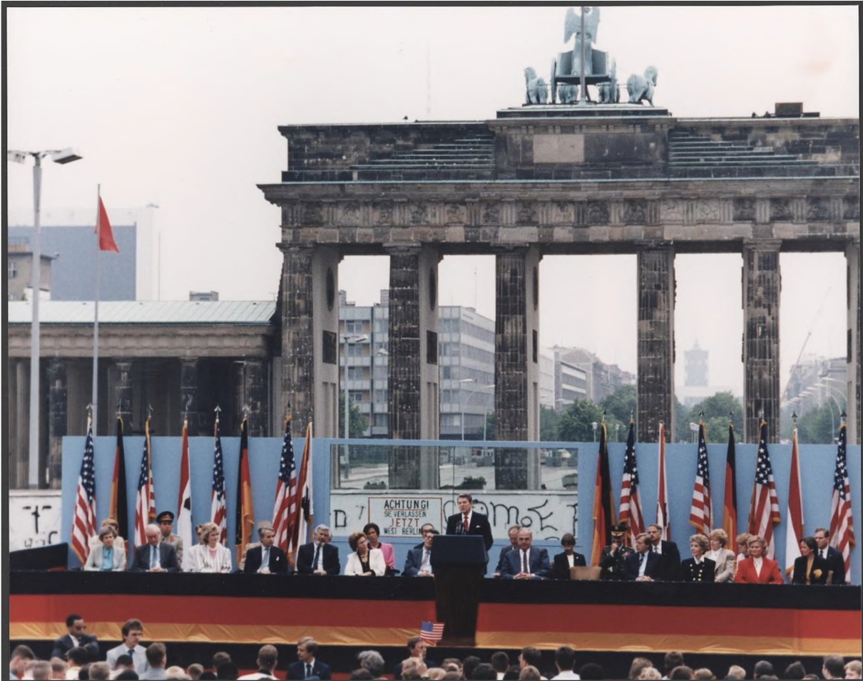
Ronald Reagan bei seiner berühmten Berliner Rede mit Appell zur Öffnung des Brandenburger Tors am 12. Juni 1987