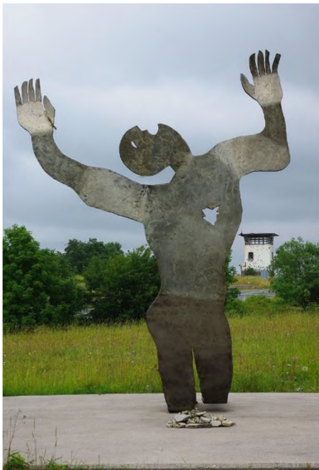
Auf der Flucht erschossen ( Jimmy Fell ) https://de.wikipedia.org/wiki/Berliner_Mauer#/media/File:Auf_der_Flucht_erschossen_%28Jimmy_Fell%29.JPG