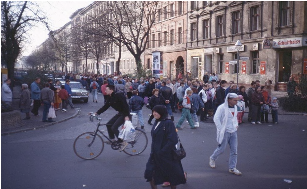
DDR-Bürger beim Schlangestehen für das Begrüßungsgeld , Mitte November 1989

https://de.wikipedia.org/wiki/Berliner_Mauer#/media/File:Berlin_Oppelner_Str._Nov._89_nach_der_Mauer%C3%B6ffnung.jpg