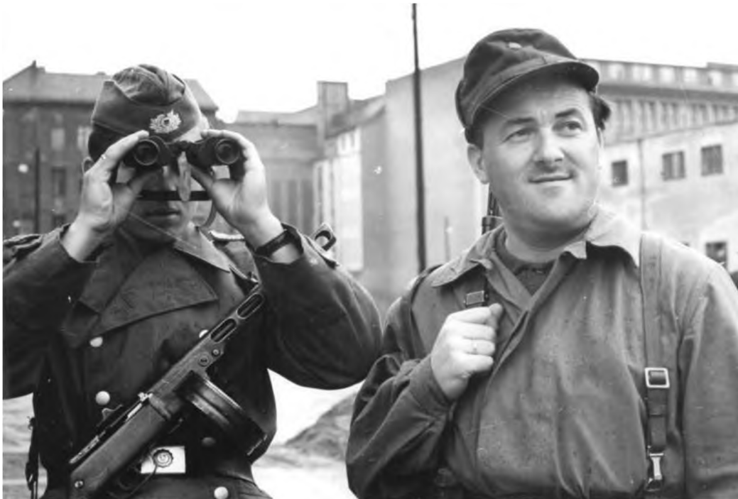
Ein Volkspolizist und ein Kampfgruppenangehöriger sichern den Mauerbau, August 1961