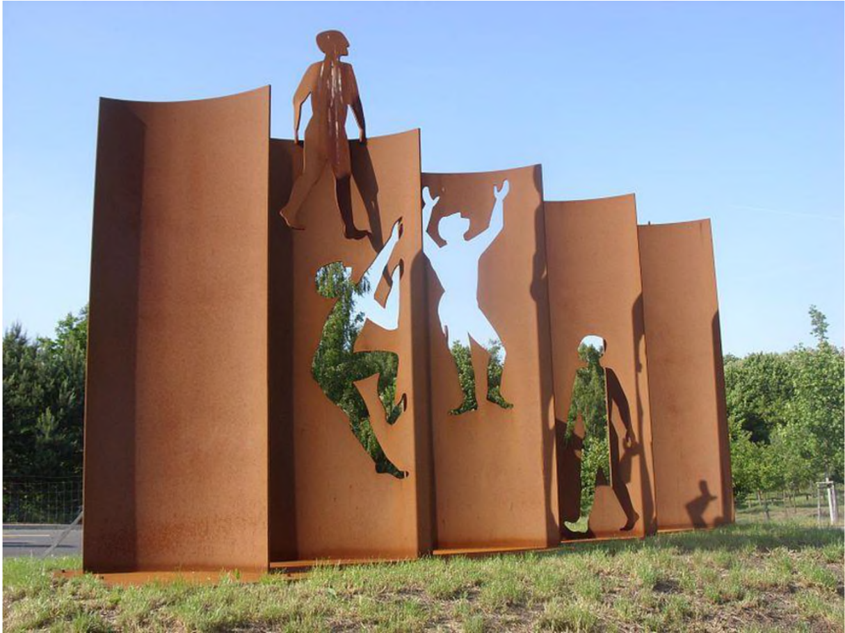
Mauerdenkmal am ehemaligen Übergang Kirchhainer Damm ( Lichtenrade/Mahlow )