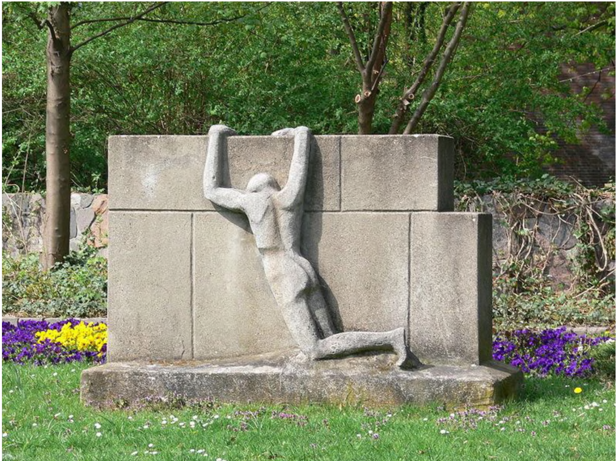
Die Skulptur Leid an der Mauer wurde 1965 in Steglitz aufgestellt.

https://de.wikipedia.org/wiki/Berliner_Mauer#/media/File:Berlin-Steglitz_vor_Matth%C3%A4uskirche_Leid_an_der_Mauer.jpg