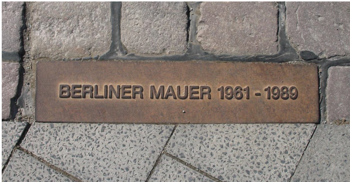
Mauer-Markierung am Nennhauser Damm ( Staaken ). Der Text ist immer von West-Berlin aus lesbar.

https://upload.wikimedia.org/wikipedia/commons/4/47/Berliner_Mauer_Gedenkmarkierung.jpg