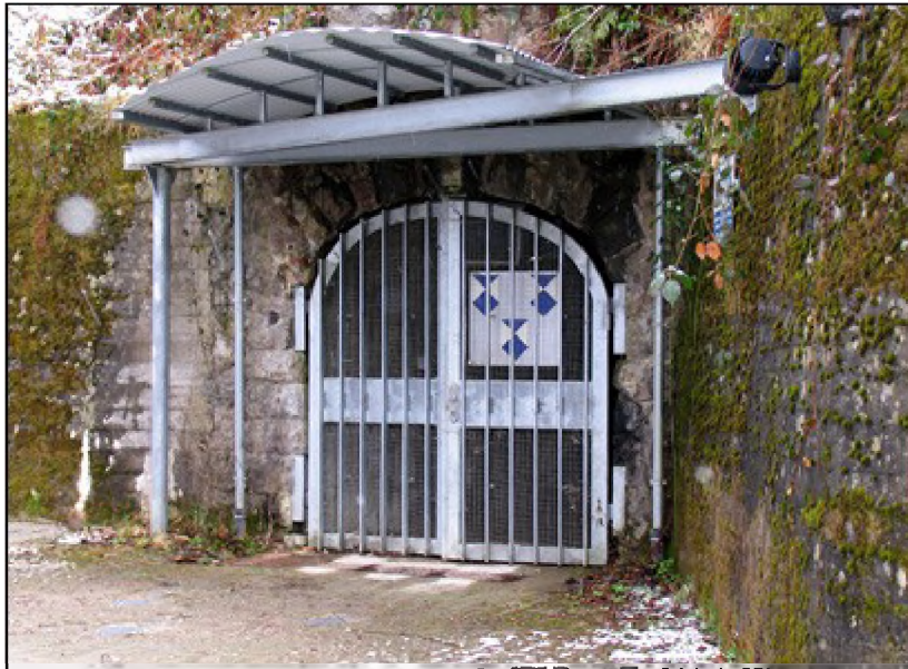
Barbarastollen im Schwarzwald: Lager für Kopien wichtiger Unterlagen - aus Angst vor Katastrophen

Aktualisiert 19. März 2009 12:36 Uhr 9 Kommentare