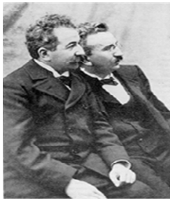
Les frères Lumière

Ainsi se succédèrent entre autres , le Thaumatrope, le Phénaskistiscope, le Zootrope, le Praxinoscope ... En 1891, le Kinétoscope de l'Américain Thomas Edison permettait même de visualiser un film mais le système imposait au spectateur de le regarder seul, debout , les yeux collés à une grosse boîte. Ce sont deux Français, deux frères, Auguste et Louis Lumière qui furent les premiers à trouver un appareil permettant à la fois de capturer les images et de les projeter à tous ... Louis avait tout simplement eu l'idée de s'inspirer du mécanisme de la machine à coudre . Les deux frères brevetèrent leur invention en mars 1895. Ils l'appelèrent le Cinématographe (du grec Kinéma : mouvement et Graphein : écrire)