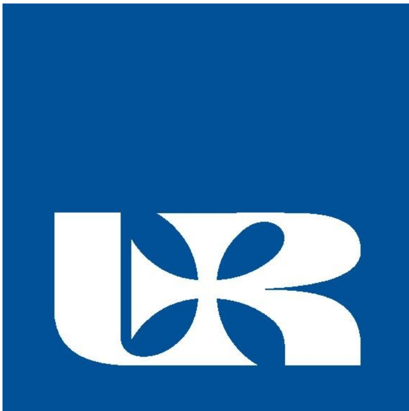
Rysunek 1.1: Logo UR.

ultricies tellus. Proin et quam. Class aptent taciti sociosqu ad litora torquent per conubia nostra, per inceptos hymenaeos. Praesent sapien turpis, fermentum vel, eleifend faucibus, vehicula eu, lacus.