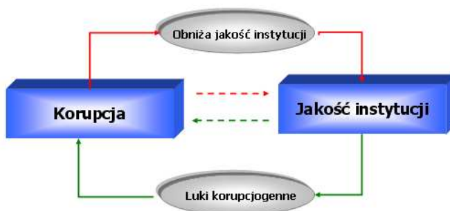
Rysunek 1. Sprzężenie zwrotne: korupcja-system instytucjonalny.

Korzenie korupcji sięgają znacznie głębiej niż słabość i nieefektywność rządu. Zachowania korupcyjne należy rozpatrywać także w kontekście etycznym, czy w kontekście jakości kapitału społecznego, gdyż korupcja i nadużycia to sprawa ludzkich zachowań. Z pewnością znaczna część takich nieetycznych zachowań jest odziedziczona w postaci swoistych „wzorców postaw i doświadczeń” po uprzednim systemie gospodarki nakazowo-rozdzielczej. To dziedzictwo to m.in. mechanizmy proceduralne, instytucjonalne i kulturowe, które są swoistym załącznikiem zachowań korupcyjnych.