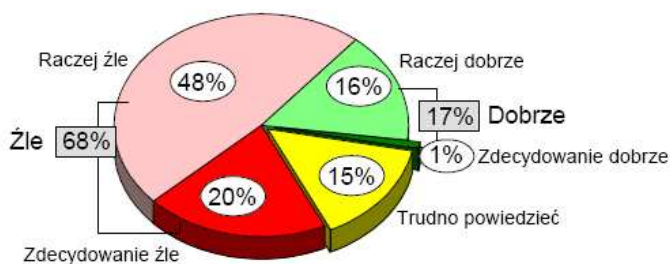
Rysunek 2. Ocena działalności Sejmu wg opinii publicznej

Na pograniczu kosztów społecznych i ekonomicznych, jako negatywną konsekwencję zachowań korupcyjnych, należy wymienić utratę zaufania do instytucji publicznych. Brak zaufania podważa legitymizację tychże instytucji, utrudnia wykształcenie się społeczeństwa obywatelskiego, obniża zasoby kapitału społecznego. Wg sondażu CBOS z lipca 2006 r. 68% ankietowanych negatywnie oceniło działalność Sejmu (zadowolone z jego pracy wyraziło 17% badanych), Prezydent RP uzyskał pozytywną ocenę wśród 35% ankietowanych (48% opinii negatywnych).