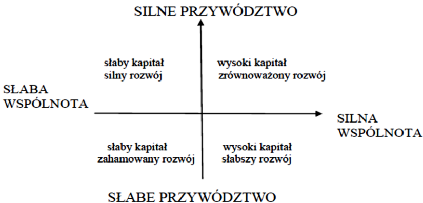
Rysunek 3. Zależność między siłą wspólnoty a siłą przywództwa

Ekonomiści wskazują dodatkowo, że w rozwoju zbiorowości terytorialnych kapitał społeczny nie jest czynnikiem wystarczającym, a czasami wręcz przeszkadzającym. Kluczowe znaczenie przypisują zarządzaniu lokalnemu, które można sprowadzić do charakteru przywództwa lokalnych władz 3 (rysunek 3) [Trutkowski, Mandes, 2005, s. 285–286].