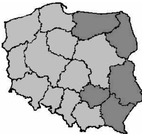
Rysunek 2. Podział polskich regionów

no-gospodarczego o wyraźnie lepszych szansach dalszego rozwoju [Skodlarski, 2000, s. 238]. Tego typu bieguny rozwoju wyraźnie dominują na zachodzie i w centrum Polski (tzw. Polska „A”). Zachodnio-centralna Polska wykazuje tendencje wzrostu podstawowych wskaźników makroregionalnych. Na rozwój tych terenów wpływa położenie, nie tylko przyciągające bezpośrednich inwestorów, ale również rozwój ożywionej współpracy transgranicznej, gospodarczej i politycznej [Hausner, Kudłacz, Szlachta, 1998, s. 37].