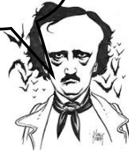
Edgar Allan Poe

Aluzje do literatury „wysokiej” w kulturze „popularnej” – twórcze czy pasożytnicze?